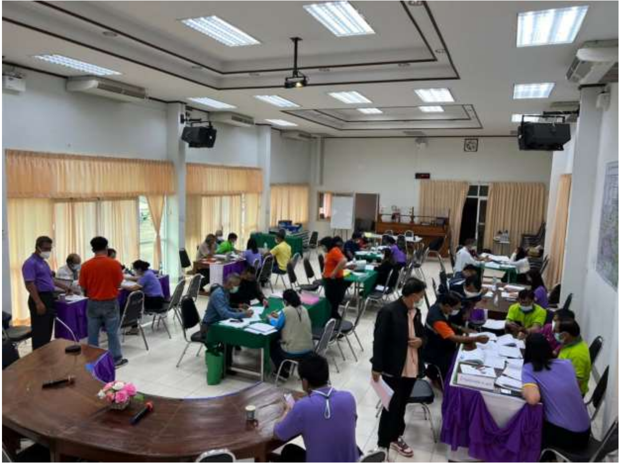
๗.จัดทำแผนการดำเนินงานและประชาสัมพันธ์แผนการดำเนินงาน